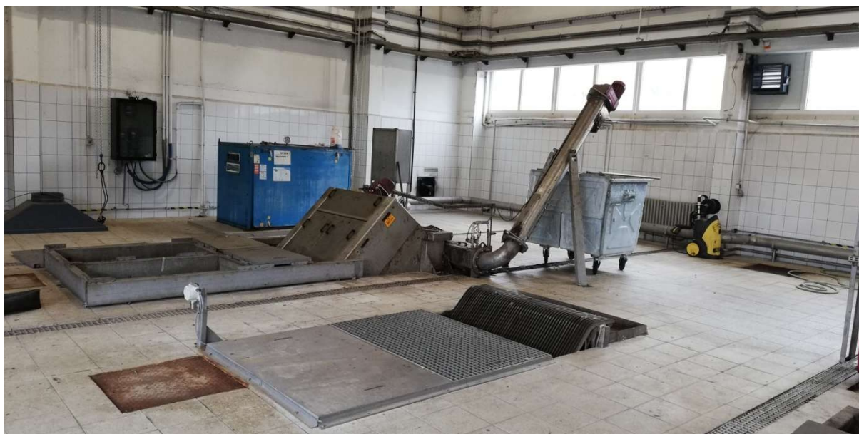
Fotografia 2.. Hala krat - fotografia rejonu kraty ręcznej i kraty mechanicznej