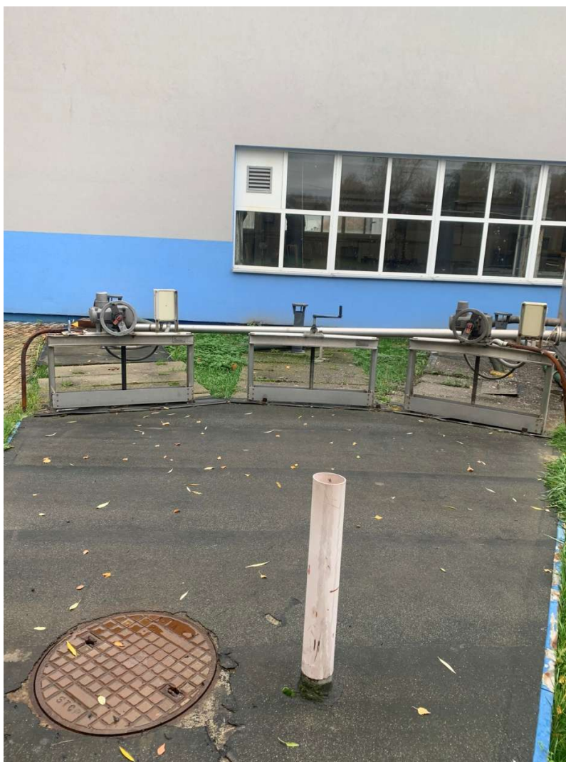
Fotografia 4. Hala krat – fotografia kanałów wlotowych