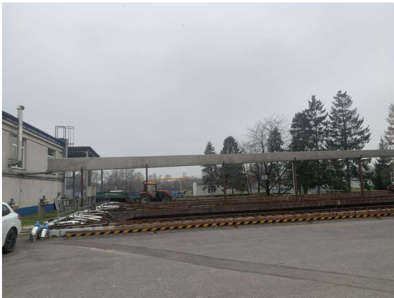
Fotografia 7. Przykładowa instalacja pulpy piaskowej

Doprowadzenia rurociągu do hali krat, należy wykonać w miejscu istniejącego okna. Pozostałą część okna zaślepić poprzez zamurowanie otworu pustakami lub bloczkami silikatowymi wraz z ułożeniem wypraw tynkarskich, w tym warstw termoizolacji. Kolorystyka i faktura warstw elewacyjnych tynku zewnętrznego w nawiązaniu do części istniejącej. Należy przewidzieć malowanie co najmniej całej ściany szczytowej poddawanej przebudowie czyli części po przebudowach razem z fragmentami nie podlegającymi przebudowie. Linie odcięcia barw ustalić na budowie w nawiązaniu do krawędzi i załamania elewacji.