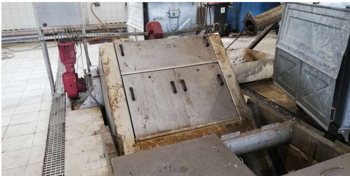
Fotografia 3.. Hala krat– fotografia zabudowy kraty istniejącej