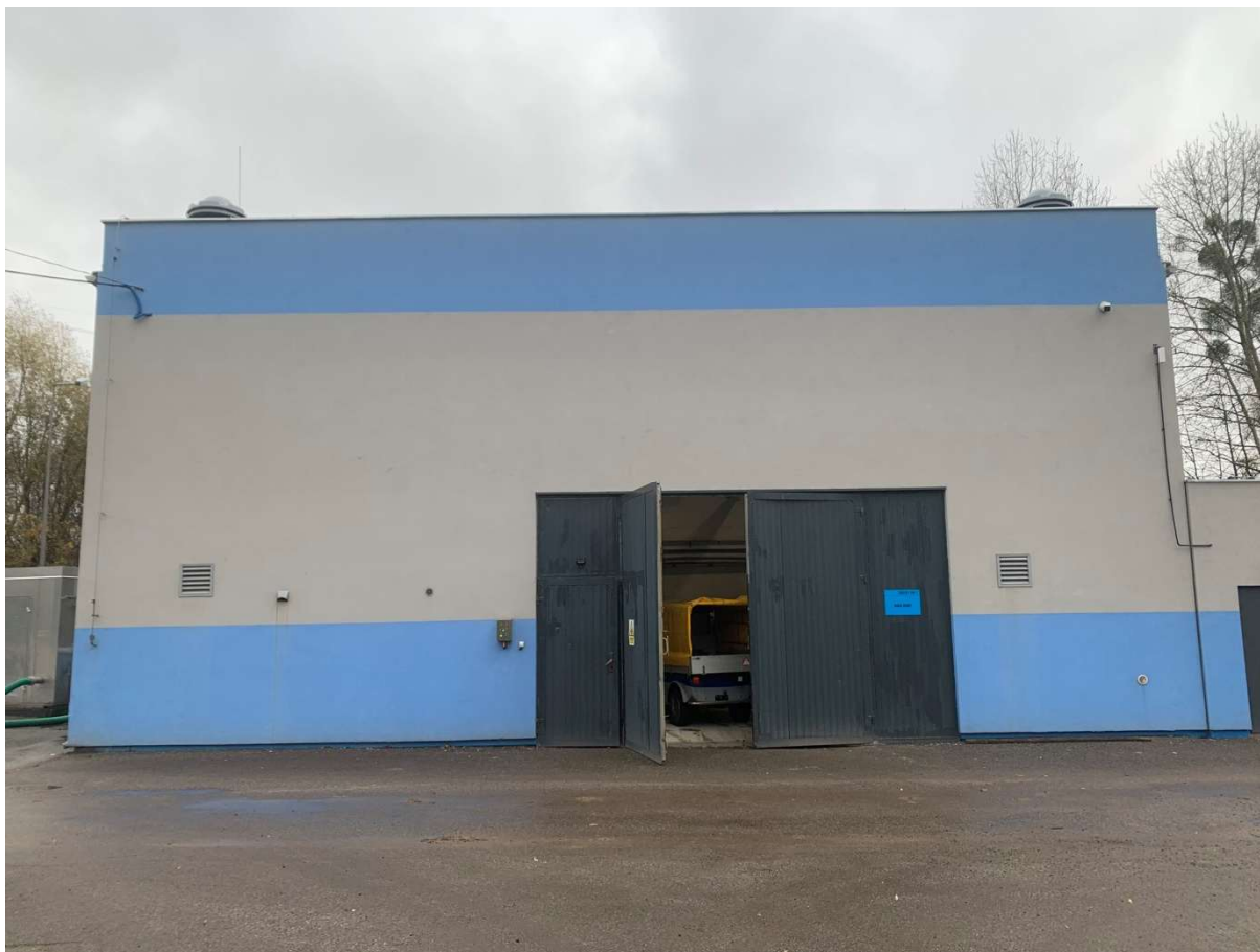
Fotografia 1.. Hala krat – fotografia bramy głównej