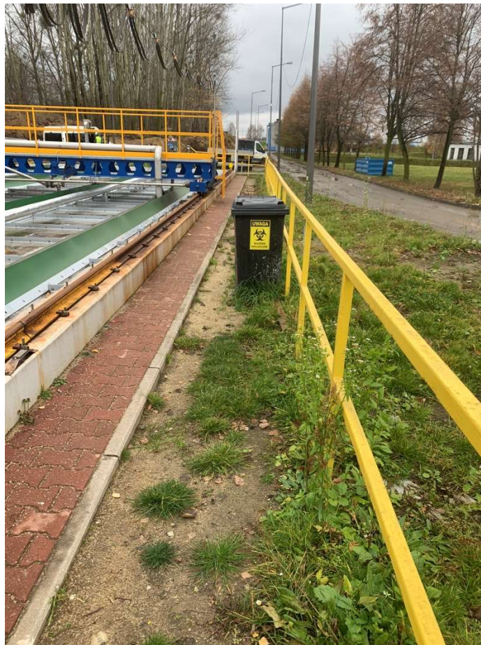
Fotografia 6. Piaskownik – fotografia miejsca lokalizacji estakady do transportu pulpy piaskowej