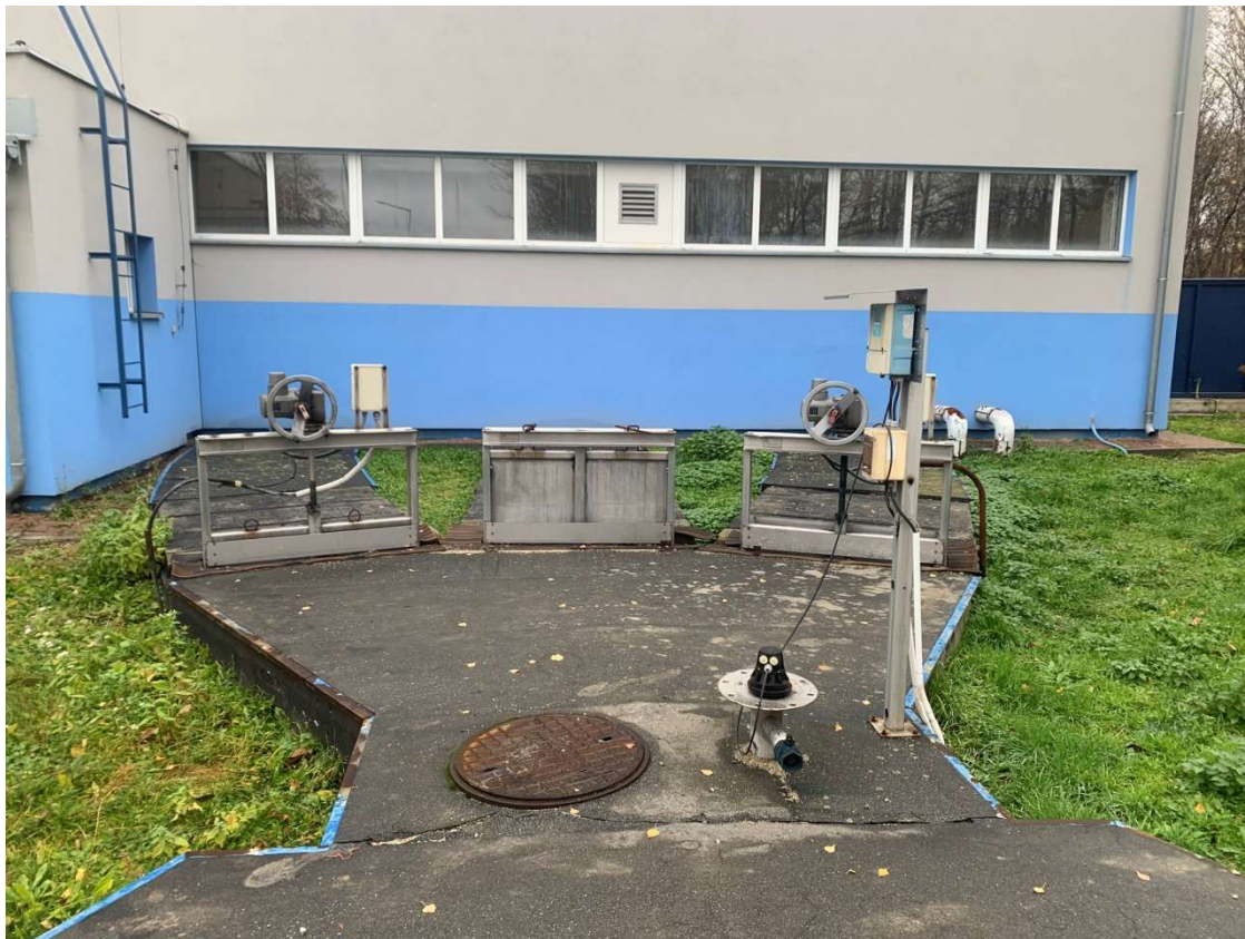
Fotografia 5. Hala krat – fotografia kanałów wylotowych